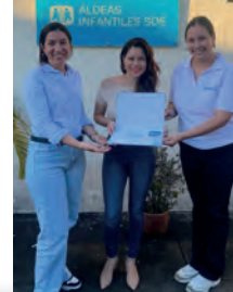
Tienda Me Encanta