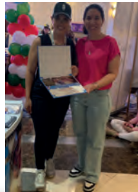
El Pop Up