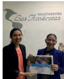
Multicentro Las Américas