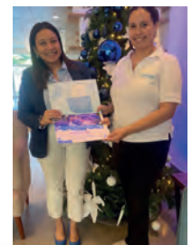
Holiday Inn Express