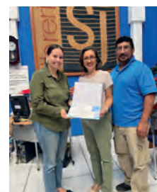
Librería San Jerónimo